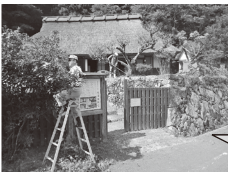
▲地元の皆さんとボランティアスタッフの息のあった作業で地内は見違えるようにきれいになりました