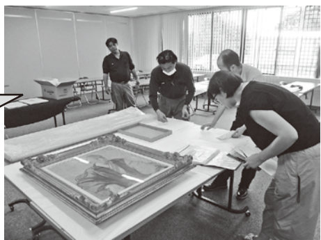
▲資料の引渡しは当館学芸員立ち会いのもと入念に行い丁寧な美術梱包を施して無事東京へ送り出しました

9月29日(日)、重要文化財永沼家住宅(犀川帆柱)で保存協会と文化遺産ボランティア合同の地内清掃が行われました。昨年起きた災害復旧工事も完了し、見学者を気持ちよくお迎えする準備が徐々に整いました。