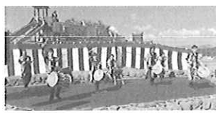
▲昨年の豊前国府まつりの様子 上:火起こし体験/下:ステージ発表