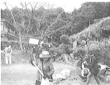
▲橘塚古墳では解説板クリーニングと周辺清掃を行いました

9月26日(木)、 Guamから来日したオリンピック事前合宿中の3名の陸上競技選手が練習の合間に橘塚古墳を訪れました。当日は、黒田小学校の6年生が一部英語を交えて母校のシンボルについて詳しく説明しました。