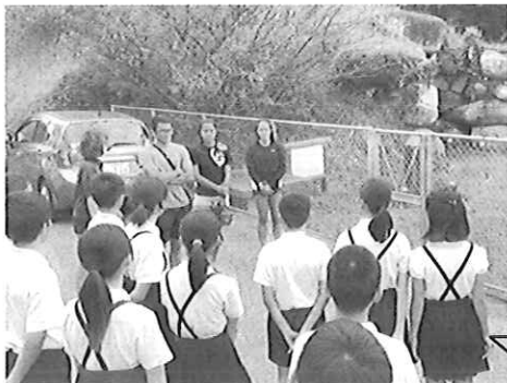
▲校歌の披露などみんなで考えた素晴らしい「おもてなし」ができました