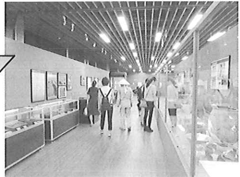
▲みやこ町の弥生文化を広く知っていただく機会になりました