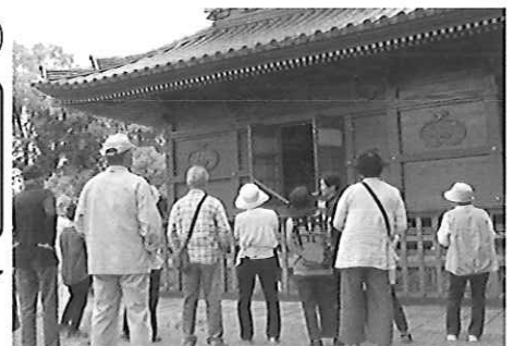
▲国分寺三重塔の見学風景。みやこ町の「万葉の世界」を満喫した1日となりました。