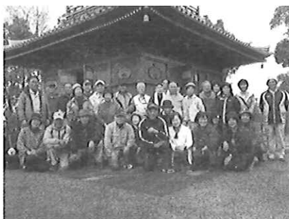
▲博物館友の会と文化遺産ボランティアメンバーによる三重塔すす払い ほかにも様々な楽習事業に取り組んでいます

博物館は郷土資料と学芸員らのサポートによる知と学びの拠点です。以下の会や講座を利用して楽しく学びませんか？詳しくは博物館まで気軽にお問合せください！