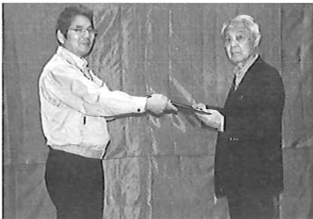
▲二人の兄弟を顕彰していく上で欠かせない大変貴重な資料を寄贈していただきました。

6月2日（日）企画展関連事業「みやこ町で見る、学ぶ「令和」と万葉の世界」と題したバスハイクが実施されました。当日は、町内外から数多くの参加者がみられ、「万葉の時代」にこの町が非常に重要な政治・文化の拠点地域であったことを「見て学ぶ」ことができました。