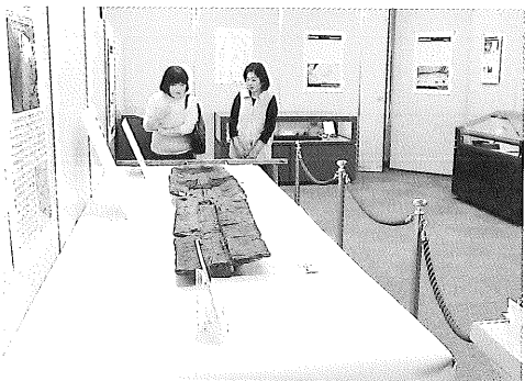
▲延永ヤヨミ園遺跡出土木樋(写真中央)ほか約50点が勢揃い

9月27日(火)から13日間、企画展示室で九州歴史資料館との共同事業「発掘速報展2016」が開かれました。東九州道建設に伴う発掘調査の成果報告で、貴重な資料の「里帰り展」となりました。