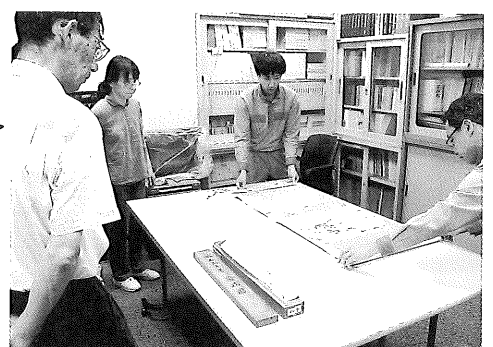
▲貸出を前に資料の現状を点検してから梱包します