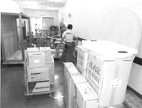
▲搬出を待つ大量の荷物。大変な作業になりました

9月20日(土)、開館20周年と歴史文化カレッジの開講を記念する特別講演会が開かれました。煎茶文化の普及に九州の果たした歴史的役割が大きかったことなどをお話いただきました。