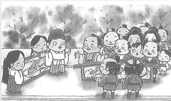
▲「生立さまのしぼり籠」のワンシーン