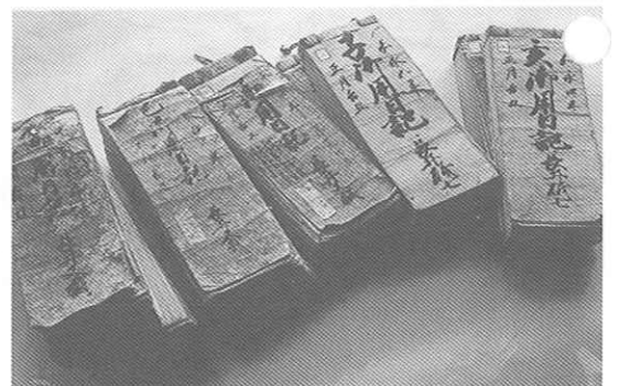
▲長井手永大庄屋文書（九州大学附属図書館付設記録資料館蔵）

大庄屋の役宅 初期の大庄屋は自らの屋敷で仕事をしたと思われませんが、のちに大庄屋を官僚化するため任地を異動させるようになると、その仕事場と住居を兼ねた建物「役宅」が各手永に設けられるようになりました。役宅のあり方には様々なパターンがありますが、例えば長井手永大庄屋の場合、仲津郡大村にあった「御本陣」という、藩主や藩の役人などが使用した公的宿泊施設が役宅に転用されました。具体的には、大村に三棟あった御本陣のうち、「中御本陣」と呼