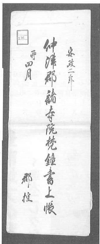
▶永井文書「安政二年 仲津郡諸寺院梵鐘書上帳」(九州大学記録資料館所蔵) 永井文書は仲津郡長井手永(現みやこ町犀川の部)の大庄屋文書

ただ、幸いなことに、旧仲津郡（現みやこ町犀川・豊津と行橋市の一部）については安政二年（一八五五）に行なわれた寺院梵鐘の所在調査史料「仲津郡諸寺院梵鐘書上帳」（九州大学記録資料館所蔵永井文書。以下、「安政二年書上帳」と仮称）が現存しているの