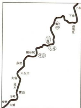
第78図 犀川と川舟ルート