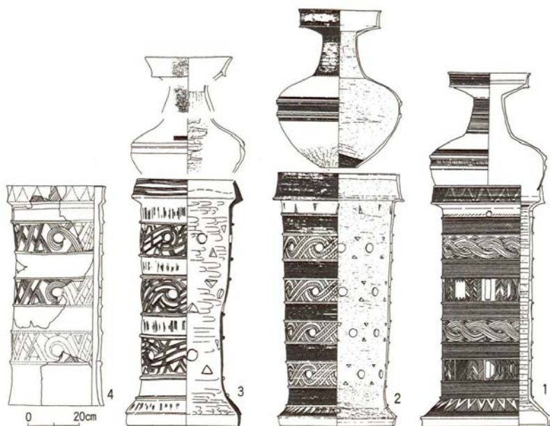
第8図 特殊器台形土器から円筒埴輪へ

には、恒常的な生産工房が存在する。五世紀前半の誉田御廟山古墳（応神陵）を擁する河内古市古墳群では、藤井寺市土師の里遺跡と羽曳野市誉田白鳥遺跡が知られ、誉田白鳥遺跡では九基の窯跡が発見されている。また、大阪府北部の三島野古墳群でも、五世紀中ごろから六世紀中ごろの埴輪窯一八基・埴輪工房三棟と工人の集落からなる高槻市新池遺跡が発見されている。 各種の埴輪のうち、円筒埴輪は当初から製作されているが、家形埴輪や楯・靱・短甲・大刀などの武具形埴輪、蓋・翳などの首長の權威を示す埴輪などは五世紀前半に盛んに作られる。その後五世紀後半に