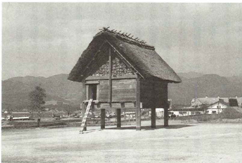
第9図 高床倉庫（佐賀県吉野ヶ里遺跡での復原）