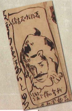
夏目漱石 直筆のイラスト (当館所蔵)