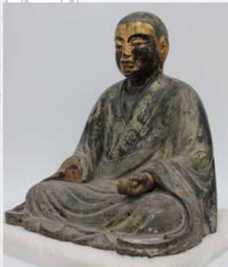
▲木造僧形八幡神坐像