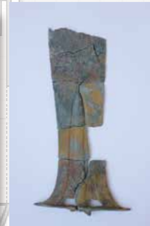
▼国作八反田遺跡出土銅戈