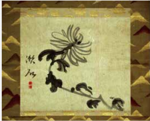
▲夏目漱石自筆「菊図」(小宮豊隆資料)