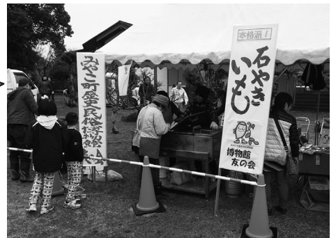
▲三重塔まつりでの友の会出店